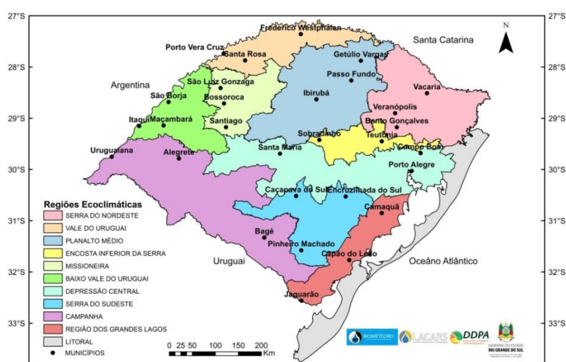
Figura 1. Regiões Ecoclimáticas do Rio Grande do Sul.

O período avaliado compreendeu os meses de dezembro de 2025, janeiro e fevereiro de 2026 (verão), conforme delimitação climatológica estacional utilizada por Berlato e Cordeiro (2017); Junges (2018).