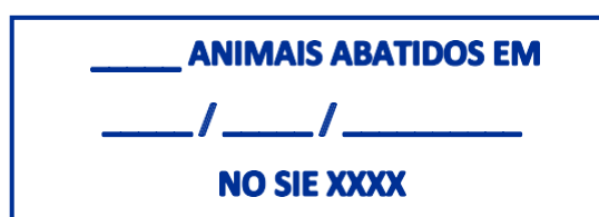
Figura 6 – Carimbo de animais abatidos

Utilizado em cada GTA, informando a quantidade de animais que foram abatidos daquela GTA ( Figura 6 ).