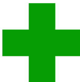
Figura 1 – Identificação do uniforme

Devido às auditorias realizadas ao longo do ano, é necessário solicitar no mínimo um conjunto extra de uniforme e botas. Sugere-se solicitar tamanhos que atendam a maioria dos colegas da Supervisão Regional correspondente.