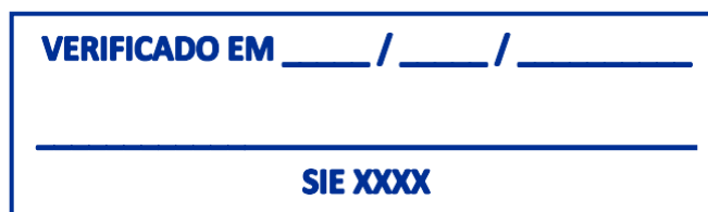
Figura 5 – Carimbo de verificação documental